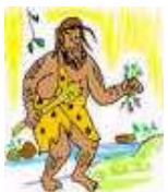
あーリー まん early man こたいじん 古代人